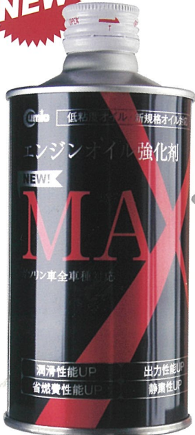
エンジンオイル強化剤 “MAX(マックス)”